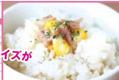
【旬の野菜の手まりプレート】1,580円(税別)