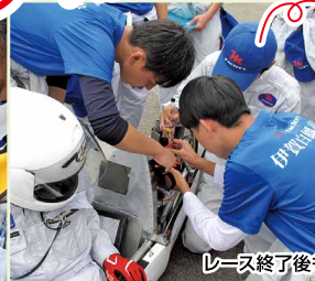
レース終了後も、チームで協力し残った燃料の計測へ。