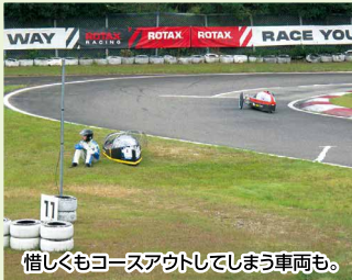
惜しくもコースアウトしてしまう車両も。