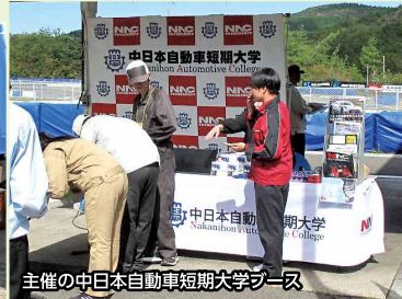
主催の中日本自動車短期大学ブース