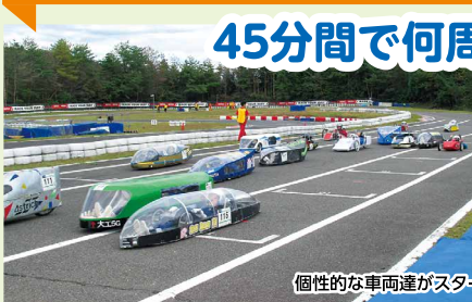
個性的な車両達がスタート地点にズラリと勢揃い!