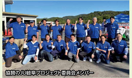
協賛のJU岐阜プロジェクト委員会メンバー