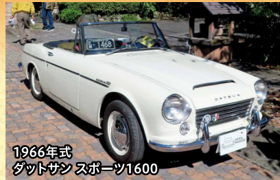
1966年式 ダットサン スポーツ1600