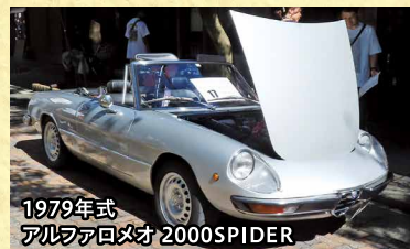
1979年式 アルファロメオ 2000SPIDER