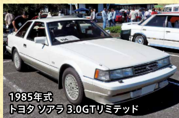
1985年式 トヨタ ソアラ 3.0GTリミテッド