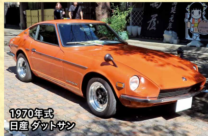
1970年式 日産 ダットサン