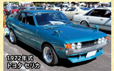
1972年式 トヨタ セリカ