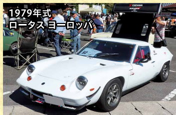
1979年式 ロータス ヨーロッパ