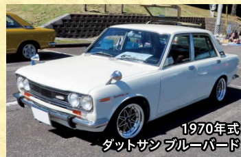
1970年式 ダットサン ブルーバード