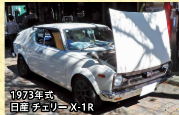
1973年式 日産 チェリー X-1R