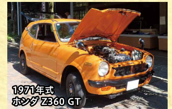
1971年式 ホンダ Z360 GT