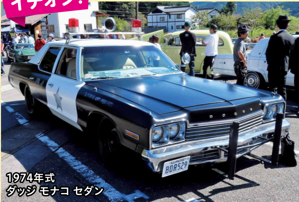
1974年式 ダッジ モナコ セダン

映画「ブルースブラザーズ」の主人公たちが乗っていた劇中車、「ブルースモービル」のレプリカです。この展示車は2022年にアメリカから輸入されたとの事です。