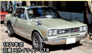
1971年式 日産 スカイライン GTR