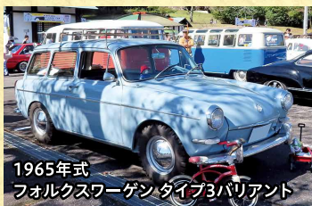
1965年式 フォルクスワーゲン タイプ3バリエーション