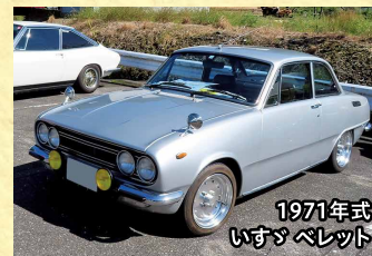
1971年式 いすゞ ベレット