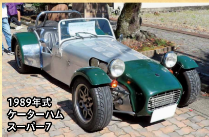
1989年式 ケーターハム スーパー7