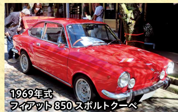
1969年式 フィアット 850 スポルトクーペ