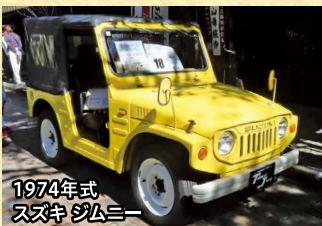
1974年式 スズキ ジムニー