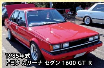
1985年式 トヨタ カリーナ セダン 1600 GT-R