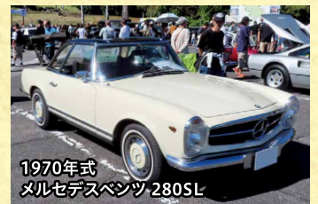
1970年式 メルセデスベンツ 280SL