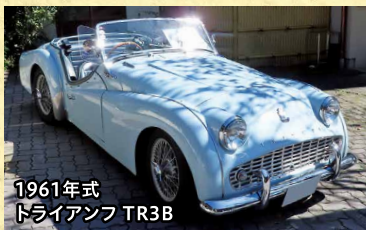
1961年式 トライアンフ TR3B

悪路に強く、小回りが利くダイハツの三輪トラックは日本の高度成長を支えてきました。