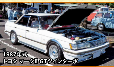
1987年式 トヨタ マークII GTツインターボ