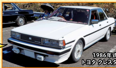
1986年式 トヨタ クレスタ