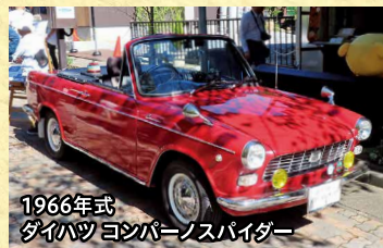
1966年式 ダイハツ ヨンバンスポーツパイダー