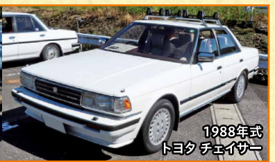
1988年式 トヨタ チェイサー