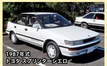
1987年式 トヨタ スプリンターシエロ