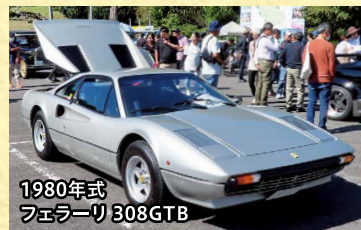
1980年式 フェラーリ 308GTB