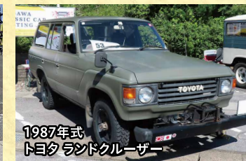
1987年式 トヨタ ランドクルーザー