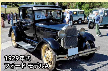
1929年式 フォード モデルA