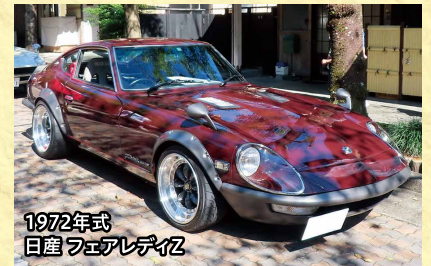
1972年式 日産 フェアレディZ