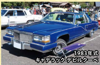
1983年式 キャデラック デビルクーペ