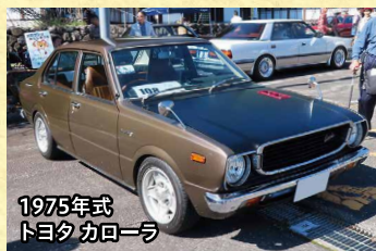
1975年式 トヨタ カローラ