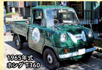
1965年式 ホンダ T360