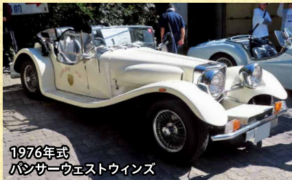
1976年式 パンサーウエストウィングス