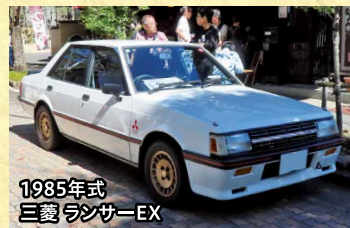
1985年式 三菱 ランサーEX