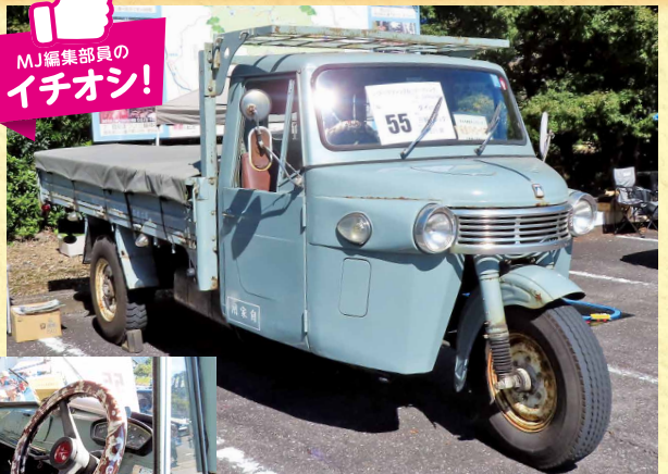
1971年式 ダイハツ 三輪トラック