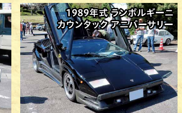
1989年式 ランボルギーニ カウンタック アニバーサリー