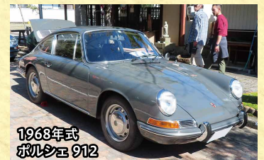
1968年式 ポルシェ 912