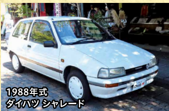
1988年式 ダイハツ シャレード