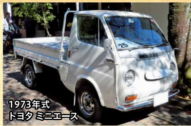
1973年式 トヨタ ミニエース