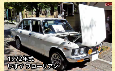
1972年式 いすゞ フローリアン