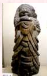
不動明王 下田 愛宕社 (岐阜県 岐阜市)